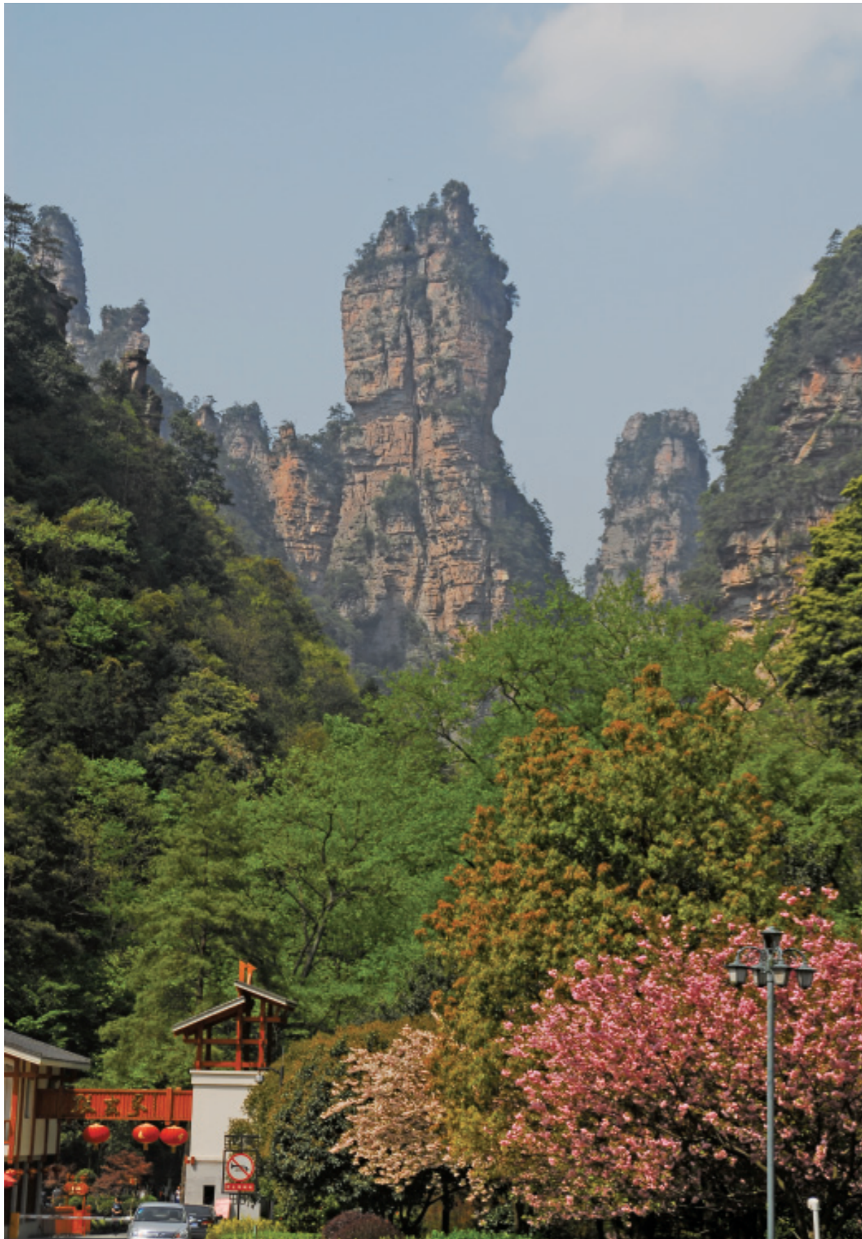
张家界一景