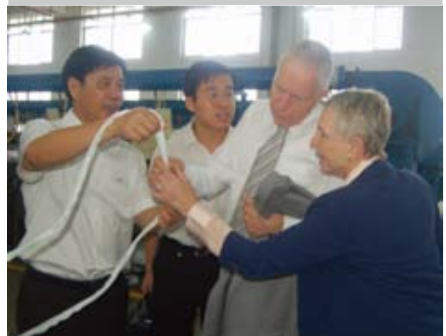
费尔普斯教授在生产车间考察拉链生产工艺