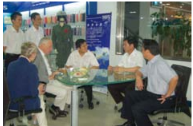
费尔普斯教授与公司领导亲切交谈

埃德蒙·费尔普斯（Edmund S.Phelps）是美国哥伦比亚大学教授，耶鲁大学博士，美国科学院院士、美国社会科学院院士。他曾提出著名的经济增长资本累积黄金定律，在加深人们对于通货膨胀和失业预期关系的理解方面作出了突出贡献。费尔普斯教授是就业与增长理论的著名代表人物。2006年，埃德蒙·费尔普斯因其“在宏观经济跨期决策权衡领域所取得的研究成就”而获得诺贝尔经济学奖，被誉为“现代宏观经济学的缔造者”和“影响经济学进程最重要的人物”之一。