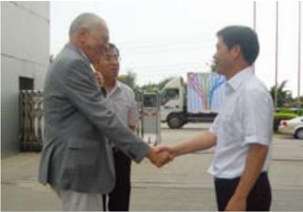
施能坑董事长（右）欢迎费尔普斯教授（左） 莅临公司参观考察

[本报讯] 2011年9月6日，诺贝尔经济学奖得主、美国哥伦比亚大学教授埃德蒙·费尔普斯在出席“晋江市民营企业传承和可持续发展高峰论坛”期间，专程莅临中国拉链行业龙头企业——浔兴股份参观考察。